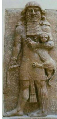
Photo : Gilgamesh et le lion