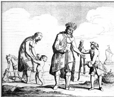
Illustration : Les géants Patagons d'après une gravure d'époque

Ayant continué au sud leur navigation, ils arrivèrent à un pays habité par un peuple fort sauvage et d'une stature prodigieuse. Ces géants faisaient un bruit effroyable ressemblant au mugissement des bœufs. Nonobstant leur taille gigantesque, ils étaient si agiles qu'aucun Espagnol ne pouvait les égaler à la course. Les marins poussèrent ensuite un peu plus loin vers le sud qu'ils croyaient inhabité. Mais voilà qu'un sauvage des contrées voisines vint les visiter. Il avait l'air vif, vigoureux chantant et dansant tout le long du chemin. Etant arrivé au port, il s'arrêta et répandit de la poussière sur sa tête. Les hommes descendirent du navire, allèrent vers lui et l'amènèrent à bord. Sa taille était si haute que la tête d'un homme de taille moyenne de l'équipage de Magellan ne lui allait qu'à la ceinture et il était gros à proportion.