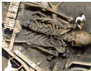
Photo ci-dessus : Photo truquée ou "hoax" d'une pseudo découverte de géant comme il en circule souvent sur internet

La paléontologie est encore aujourd'hui balbutiante. De plus en plus rapidement de nouvelles pistes viennent réfuter les anciennes et l'on recule de plus en plus l'origine de l'homme. Toumai semble être le plus ancien de nos ancêtres mais jusqu'à quand ? Demain, au hasard d'une découverte, qu'en sera-t-il ? Peut-on vraiment croire à cette histoire d'être simiesques et primitifs qui furent nos aïeux ? La science bien que très honorable est un dogme qui a remplacé celui qui primait au temps de l'Inquisition avec la Papauté : hors de l'Eglise point de Salut ! était-il dit. Aujourd'hui c'est la science qui a raison de tout car elle fait régner le dogme de la raison et hors de la sacro-sainte science nulle place à des hypothèses hardies et fondées, qui pourraient accélérer les choses. Tout compte fait cela est tout de même appréciable dans la mesure où cette méthode joue le rôle d'un garde-fou évitant à des esprits égarés de plonger dans les abîmes insondables du n'importe quoi .